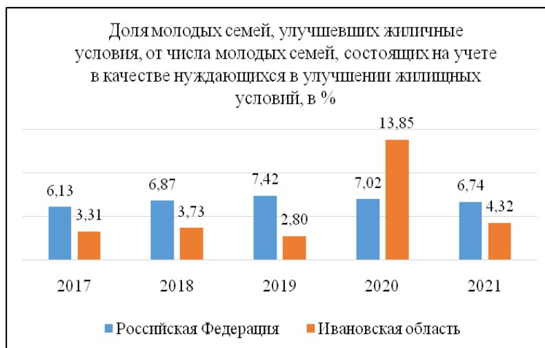
Рис. 2. Динамика доли молодых семей, улучшивших жилищные условия, в РФ и Ивановской области в 2017–2021 гг.