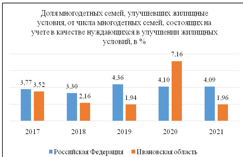
Рис. 3. Динамика доли многодетных семей, улучшивших жилищные условия, в РФ и Ивановской области в 2017–2021 гг.