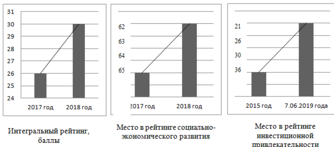
Рис.1. Динамика рейтинговых показателей Ивановской области (по данным Рейтингового агентства «РИА Рейтинг», по данным Национального рейтинга состояния инвестиционного климата в субъектах РФ)[1]

Уровень attractiveness территории является интегральным показателем величины ее аттрактивного потенциала.