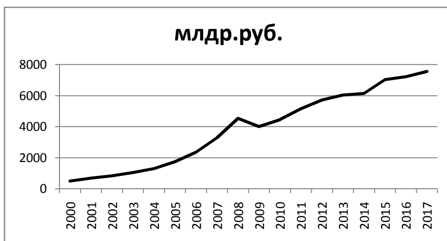
Рис. 2. Объем работ, выполненных по виду экономической деятельности «строительство» в Российской Федерации (составлено авторами на основе [5])

Объем работ, выполняемых строительной отраслью, также говорит о неуклонном устойчивом развитии сектора, несмотря на нестабильность в экономической системе и введенные санкции. Дополнительным показателем для оценки строительной отрасли могут служить показатели прибыльности сектора. В 2017 г. финансовый результат прибыльных организаций превысил финансовый результат убыточных организаций на 135,6 млрд. рублей, в 2016г. - на 39,8 млрд. рублей [6]. Кроме того, строительство является