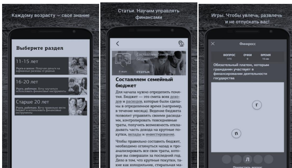
Рис. 1. Приложение «Финсовет» Fig.1 Application "FinancialCouncil"

Рассмотрим приложение «Финсовет» [9], разработанное с рекомендациями от Министерства финансов Российской Федерации и Всемирного банка (рис. 1).