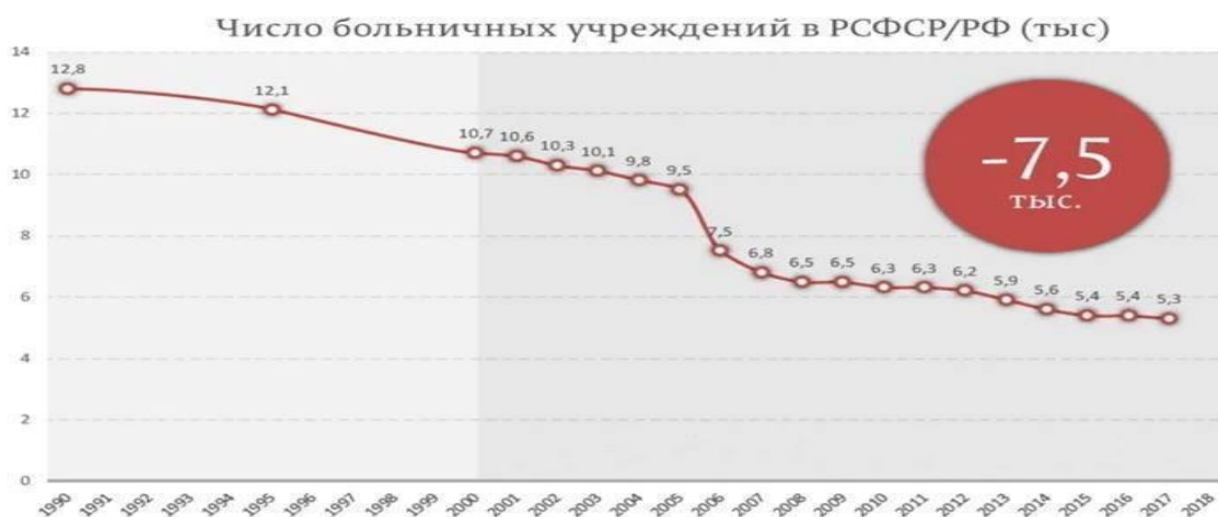
Рис. 2. Сокращение числа больничных учреждений в РСФСР/РФ Fig. 2. Reduction in the number of hospitals in the RSFSR/RF